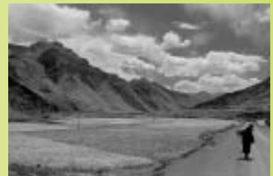
Valley road through mountain region.