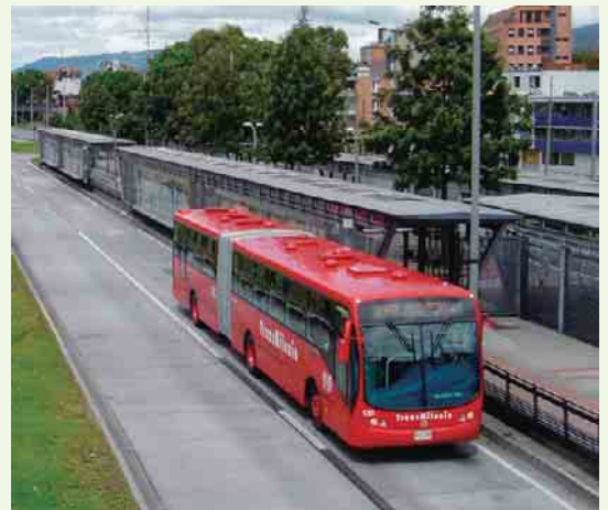
ボゴタ市の「トランスミレニオ」。老朽化したバスから生じる温暖化ガスの排出量が大幅に削減された。