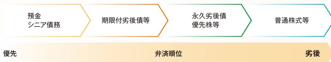
図表④ 劣後事由発生時の弁済順位イメージ